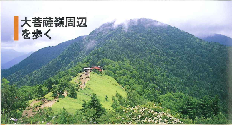
大菩薩峠北の稜線より熊沢山を望む

日本百名山にも選ばれ、古くから秩父多摩甲斐国立公園を代表する山として知られ、家族連れからベテランまでルートバリエーションが豊富な山として年間を通して多くの人を訪れる。稜線からは富士山や南アルプスなどの山並みが一望でき、登山道沿いにも多くのビュースポットが点在する。