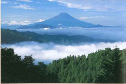
唐松尾根からの眺望

日本百名山にも選ばれ、古くから秩父多摩甲斐国立公園を代表する山として知られ、家族連れからベテランまでルートバリエーションが豊富な山として年間を通して多くの人を訪れる。稜線からは富士山や南アルプスなどの山並みが一望でき、登山道沿いにも多くのビュースポットが点在する。