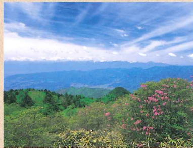
三窪高原からの眺望

柳沢峠の駐車場から1時間程で、関東の富士見百景にも数えられる三窪高原一番のビュースポット、ハンゼノ頭に着く。ここからは天候に恵まれれば富士山だけでなく、甲府盆地のはるか彼方の南アルプスの大展望も期待できる。そして、板橋峠を回って齊木林道で柳沢峠に戻ることができ、歩道も良く整備され、つつじの群落も見ることができる。